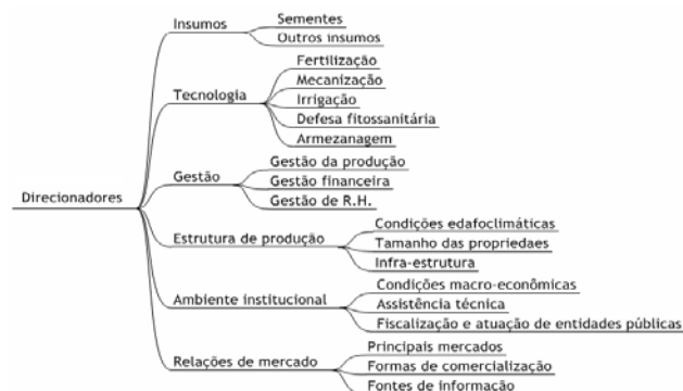
Figura 1. Direcionadores de competitividade da produção de girassol em Montes Claros.

A análise de competitividade baseia-se na metodologia proposta pela FAO, Guidelines for rapid appraisals of agrifood chain performance in developing countries (SILVA, 2007). Essa análise baseia-se na avaliação dos seguintes direcionadores: a) insumos; b) tecnologia; c) gestão; d) estrutura da produção; e) ambiente institucional e; f) relações de mercado; como mostra a Figura 1.